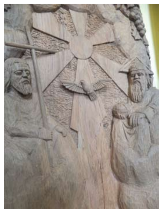
Rimanto Zinkevičiaus drožiniai: Šv. Jurgis nugalė blogio slibiną ir Šv. arkangelas Mykolas. Šv. Trejybės paslaptis...