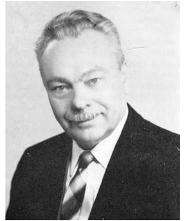
Profesorius Kazimieras Pakštas visą gyvenimą nepaliovė tikėti šviesia lietuvių tautos ateitimi, ieškojo sėkmės kelių.

Švenčiant Šventosios dieną, 2016 metų vasarą Butėnuose ant senosios Pakštų sodybos ulyčioje trobos buvo pritvirtinta lentelė su užrašu, kad čia tarpukario vasaromis lankydavosi