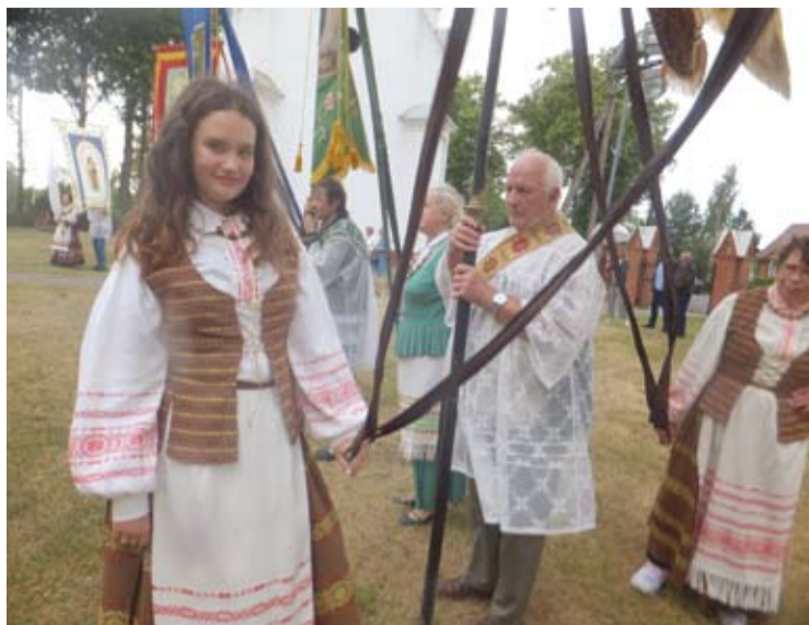
Ruošiasi procesijai aplink Svėdasų bažnyčią.