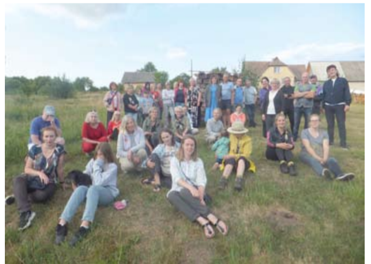
Žygio „Svėdasai: gatvės, žmonės, praradimai ir atradimai“ dalyviai, įveikę mažąjį upelį, stabtelėjo Aliutės kalno papėdėje.

barstytojų, maršalkos procesijoje stygo, o ir žmonių palyginus nedaug susirinko. Vertėtų tokią šventą dieną parapijiečiams ir kraštiečiams gausiau susirinkti, bendrystę ir tradicijas uoliau palaikyti. Miestelis gi labai greitai ištuštėjo – juk neveikia jokia arbatinė, kavinė ar užkandinė, visi išsiskubino namo ar į svečius šventinių pietų. Tačiau bene daugiausia džiaugsmo suteikė vėlyvą popietę virš Svėdasų, pagaliau po ilgos sausros, pirmą kartą skalsiai, gausiai žemę palaistęs ir visa, kas gyva, atgaivinęs lietus.